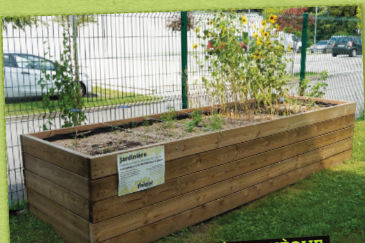
JARDINIÈRE DE LA MÉDIATHÈQUE

La Grainothèque est un lieu où il est possible de prendre et déposer des graines librement et gratuitement.