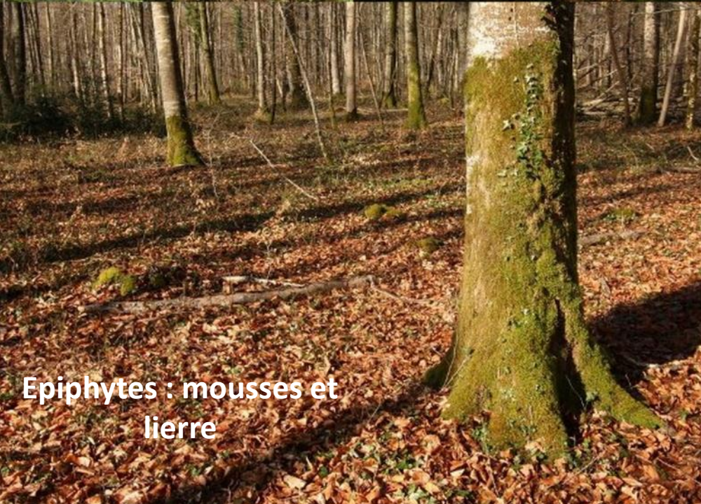
Epiphytes : mousses et lierre