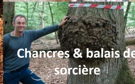
Chancres & balais de sorcière