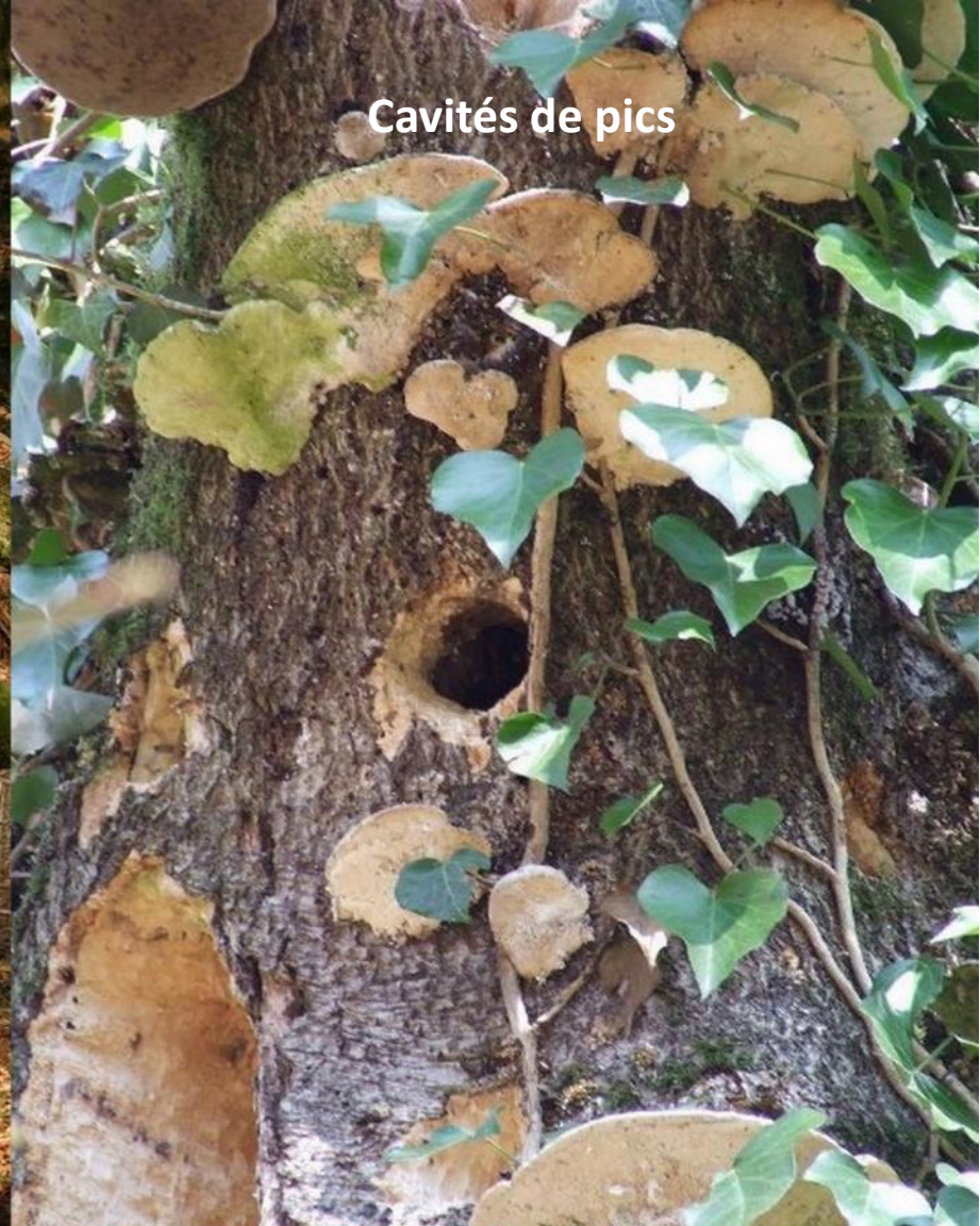
Cavités de pics