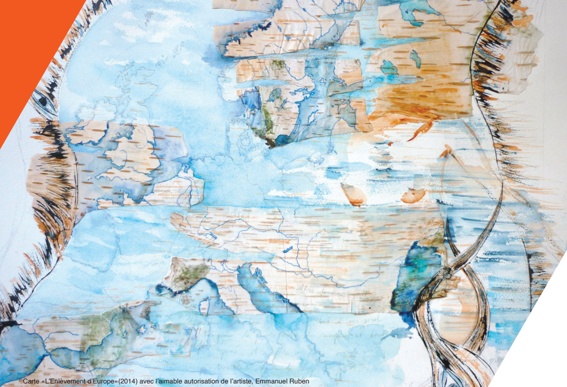
Carte «L'Enlèvement d'Europe»(2014) avec l'aimable autorisation de l'artiste, Emmanuel Ruben