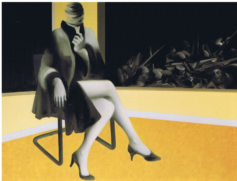
Femme assise n° III , huile sur toile, 1983, Henry Le Chénier Catalogue Musée Granet p. 35 © collection de l'artiste

(lecture d'un monde avant qu'il ne disparaisse)