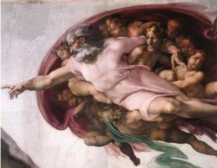
La création d'Adam (détail), Michelangelo, 1508-1512 pintura fresca, plafond de la chapelle Sixtine