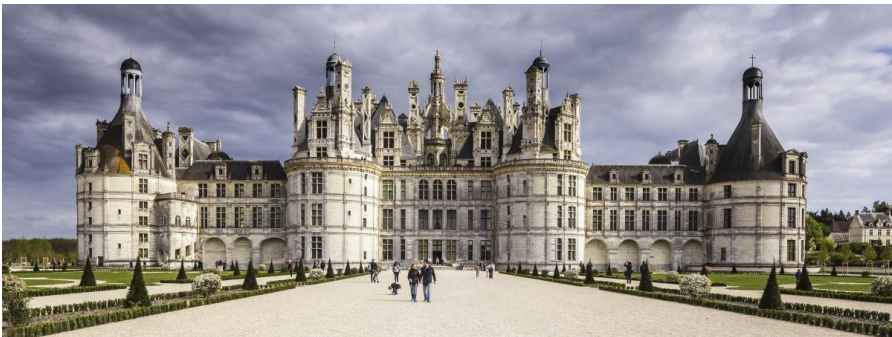
Château de Chambord , conception centrale attribuée à Leonardo da Vinci - date de début de la construction : 6 septembre 1519

À suivre : Sommaire détaillé ; Tableau chronologique ; Dossier iconographique (nécessitant probablement démarches administratives et autorisations) > voir version A4