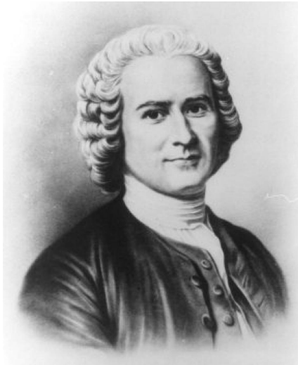
Portrait de « l'angélique » Jean-Jacques Rousseau (site Internet : http://www.pcf.fr )

Pour autant, nous ne pouvons donner à cette seule pensée un blanc-seing. Car lui-même n'échappe ni à sa propre trajectoire ni aux bouillonnements de son époque. Ce qui revient à poser la question : « Qui est réellement Alexis de Tocqueville ? ». Et, accessoirement : « Que nous dit-il exactement ? ».