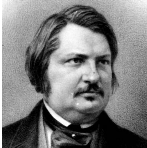
Honoré de Balzac à l'apogée de sa gloire