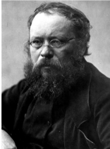
Pierre-Joseph Proudhon en 1840 (site Internet : http://www.integrersciencespo.fr )