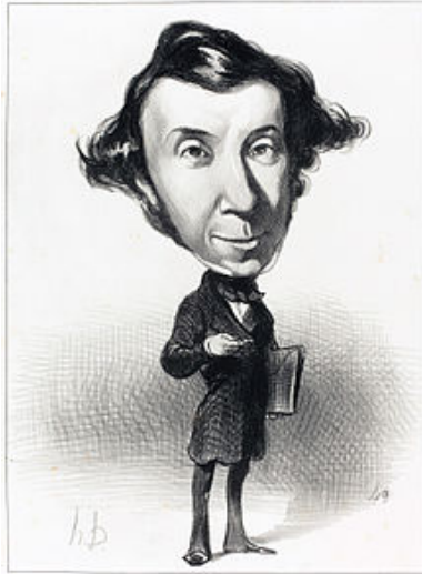
Alexis de Tocqueville croqué par Honoré Daumier

Tout cela n'est pas sans rappeler, toutes proportions gardées, ce qui s'ensuit de la première élection présidentielle de François Mitterrand. Car il suffit de revoir l'interview pleine de morgue et d'arrogance difficilement contenue du jeune premier nommé Nicolas Sarkozy pour s'apercevoir que sa critique n'était pas, elle non plus, factuelle, mais bien que la tension qu'il portait en lui était celle d'une vexation de classe à laquelle on aurait ôté les moyens de ses privilèges. Toutes ses actions futures, ainsi que celles des couches sociales qu'il drainera avec lui, et ce au prix, la plupart du temps, de mensonges démagogiques et de miroitements langagiers, n'auront dès lors que ce seul but en tête : restaurer, voire dépasser les moyens de se réapproprier les pouvoirs de l'argent qui, il n'en doute pas, leurs sont dus par définition , eu égard à un « mérite » impalpable, mais qui ne saurait devoir être à prouver. Comme s'il était induit, ou même pire, inné : c'est-à-dire acquis par naissance.