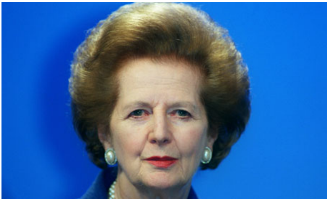
Magaret Thatcher, l'inflexible Dame de fer à l'apogée de sa toute puissance

Il est vrai qu'on nous présente continuellement le panorama économique actuel comme une récession durable et incontrôlable, laquelle justifie à elle seule la réalisation d'un processus devenu systématisé, depuis l'avènement de l'ère Thatcher, de mise à bas progressive des éléments constitutifs d'une cohérence (bien plus que d'une cohésion !) sociale hérité de l'après-guerre. Or on peut se demander si ceux qui, à la suite d'un modèle anglo-américain pourtant faillible, ont conduit ce mouvement « réfléchi » - pour reprendre le mot utilisé par Tocqueville - de la soumission sociale au dictat de l'économie individualisée, ne devraient pas se le voir imputer aux yeux de l'Histoire ? [11]