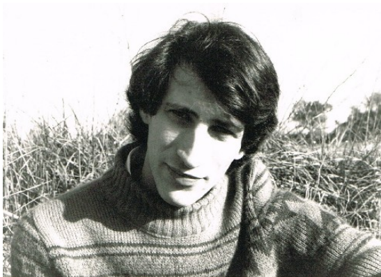
L'auteur en Provence, à l'âge de 25 ans